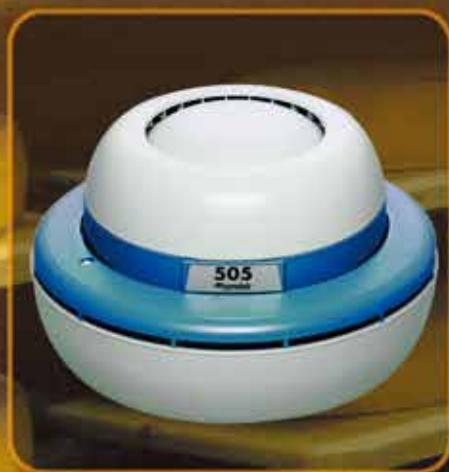
Condair 505 : Semplicemente universale

Utilizzando i deflettori è possibile indirizzare la nebulizzazione orizzontalmente o verticalmente senza alcun gocciolamento. L'unità può essere facilmente pulita e si è liberi di decidere se collegare il Condair 505 alla rete idrica oppure usare il serbatoio dell'acqua da riempire manualmente.