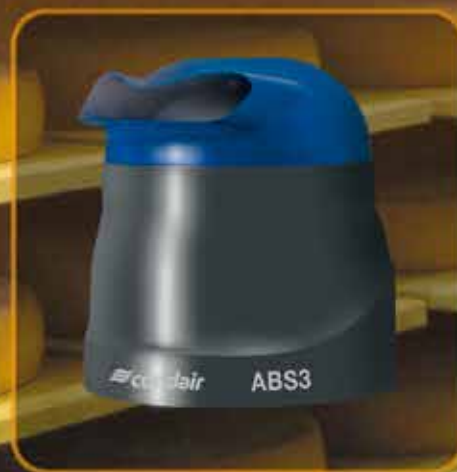
Condair ABS3: Doppia potenza

Utilizzando i deflettori è possibile indirizzare la nebulizzazione orizzontalmente o verticalmente senza alcun gocciolamento. L'unità può essere facilmente pulita e si è liberi di decidere se collegare il Condair 505 alla rete idrica oppure usare il serbatoio dell'acqua da riempire manualmente.